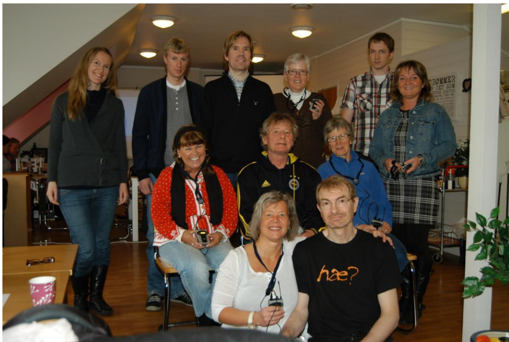
Gruppebilde + Stein Thomassen.

Dersom en ser nøye på bildet kan en se at noen av deltagerne har smykket seg med noen av det nye mobile teleslynganeanlegget som HLF Bergen nettopp har kjøpt inn. Takket være støtte og gaver fra firma og legater og grasrotandelstøtte fra våre tippere.